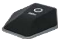
AG-20 – CAVO 20M