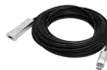
USB CSD 30M